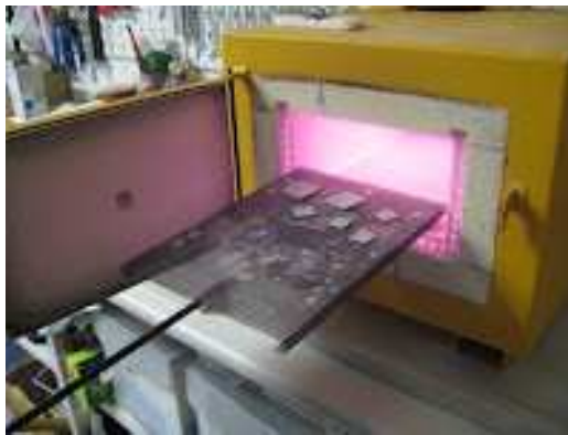
Mufla per coure l'esmalt