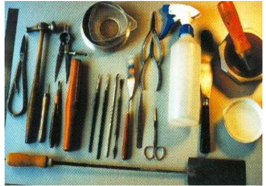
Eines precises per esmaltar